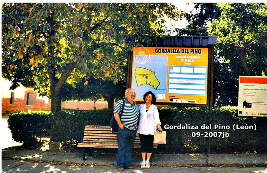
Gordaliza del Pino (León) 09-2007jb